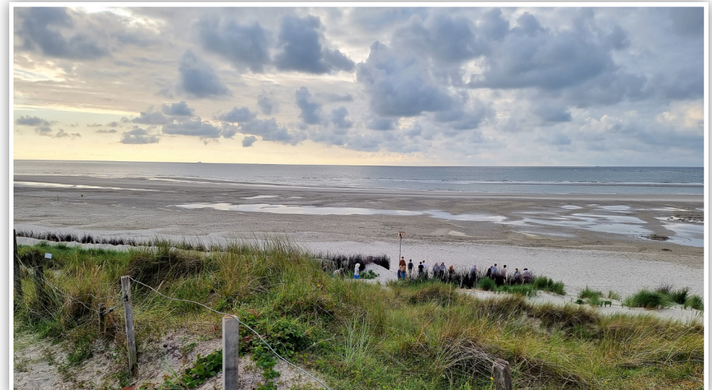
Text und Fotos: Wiebke Niebuhr

Nach so schweren Zeiten kommt Neues, und eine gute Freundschaft hilft, diese Zeiten zu überstehen.